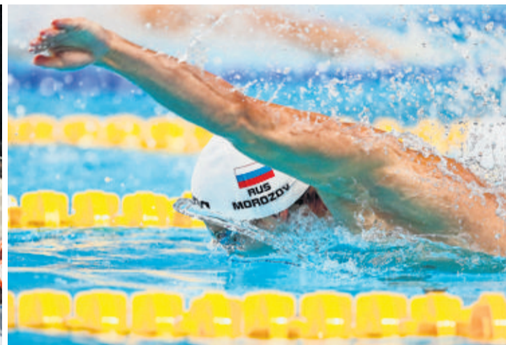
Si la gymnaste Aliya Mustafina ou l'escrimeuse Sofya Velikaya peuvent encore espérer participer aux JO, le nageur Vladimir Morozov a été recalé hier par la Fédération internationale de natation.