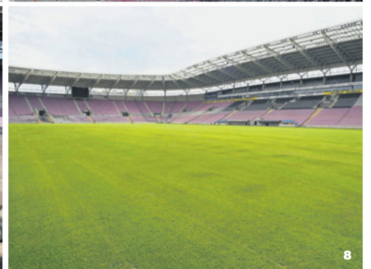
1. Au lendemain du Suisse-Belgique du 28 mai, la pelouse et son substrat sont raclés sur 35 centimètres. 2. Le système de drainage est recouvert. 3. Place aux tubes de chauffage, un véritable radiateur qui sera sous la pelouse. Cela représente 27 kilomètres de tubes de 2 centimètres de diamètre. 4. Du sable recouvre ensuite les tubes chauffants sur 15 centimètres de haut. 5. Du sable de quartz est ensuite disposé sur la couche précédente. 6. Les derniers centimètres de sable de quartz sont mélangés avec un compost qui contient des éléments organiques appelés à nourrir les racines du gazon naturel. Les rouleaux sont maintenant prêts. 7. Les ouvriers spécialisés déroulent les nombreux rouleaux, mélange pré-cultivé de pelouse synthétique et naturelle. 8. Le beau gazon est désormais prêt, majestueux, révolutionnaire.